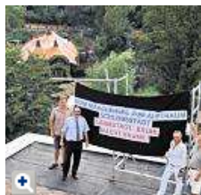
Protest gegen Wakobato: Mitglieder der Anwohnerorganisation Bovivo wehren sich gegen die Attraktion. (Archivfoto)

Das war eine Schlappe für die Stadt Brühl: Vor rund drei Wochen hatte das Verwaltungsgericht Köln die Baugenehmigung für die Phantasialand-Attraktion Wakobato für nicht rechtens erklärt. Nun stellt die Stadt Antrag auf Zulassung der Berufung.